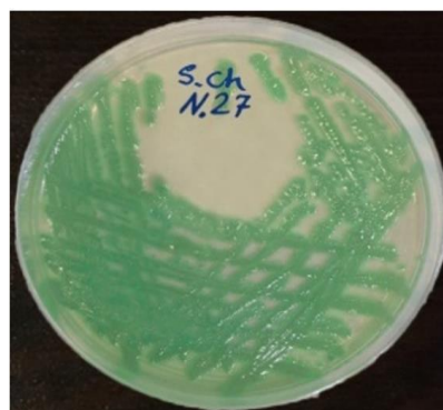
شکل ۱. کلنی‌های سبز رنگ کاندیدا/آلبیکنس در محیط کروم کاندیدا آگار

برای تشخیص گونه‌های کاندیدا/آلبیکنس، پدیده ایجاد لوله زایا بررسی شد. بدین صورت که یک کلونی از قارچ با ۱cc سرم انسانی مخلوط و ۵ ساعت درون انکوباتور ۳۷ درجه سلسیوس قرار داده شد. پس از گذشت زمان تعیین شده، مقداری از سوسپانسیون را بین لام و لامل قرار داده و زیر میکروسکوپ، ایجاد لوله زایا بررسی شد. کاندیدا/آلبیکنس در این محیط لوله زایا ایجاد می کند که طول آن ۲ الی ۳ برابر قطر سلول مادر است. در حالی که سایر گونه‌های کاندیدا، لوله زایای بسیار کوتاهی داشته یا اصلا لوله زایا ایجاد نمی کنند. در روشی دیگر، کشت در محیط کروم آگار کاندیدا انجام شد. بدین ترتیب که یک کلونی از کشت تازه کاندیدا، روی محیط کروم کاندیدا آگار به صورت خطی کشت داده و در انکوباتور با دمای ۳۷ درجه قرار داده شد. بعد از گذشت ۲ روز، رنگ ایجاد شده کلونی روی محیط کشت بررسی شد؛ بدین صورت که کلنی سبز رنگ (شکل ۱) مشخصه بارز کاندیدا/آلبیکنس بود (۱۳).