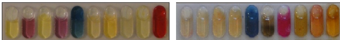
شکل ۲: نتایج تست کیت آنتروباکتریاسه - سمت راست: باکتری Proteus vulgaris - سمت چپ: Enterobacter cloacae