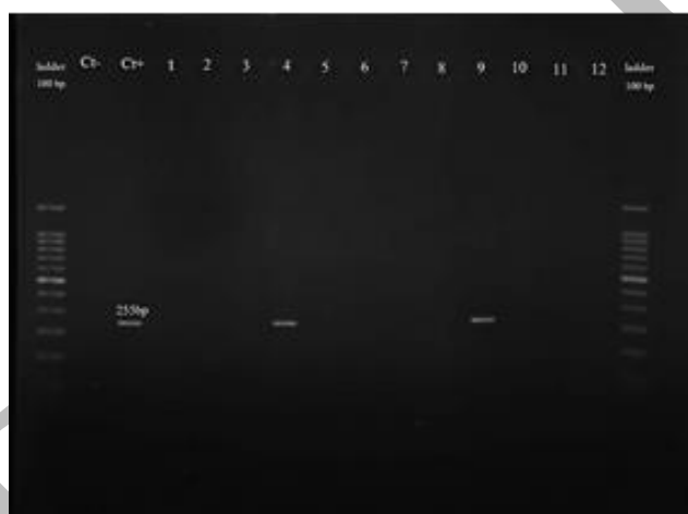
شکل ۱. نتایج ژل الکتروفورز حاصل از PCR کلامیدیا تراکوماتیس (۲۵۵ bp) به همراه کنترل مثبت (Ct+) و کنترل منفی (Ct-)