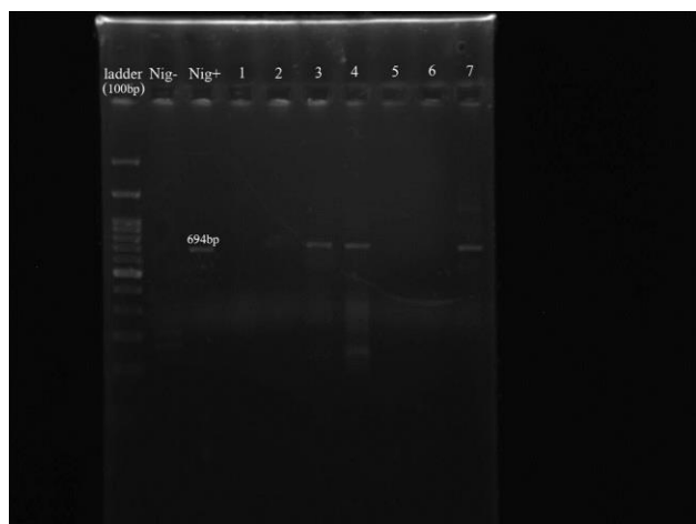
شکل ۳. نتایج ژل الکتروفورز حاصل از PCR نایسریا گنوره آ (۶۹۴bp) به همراه کنترل مثبت (Nig+) و کنترل منفی (Nig-)