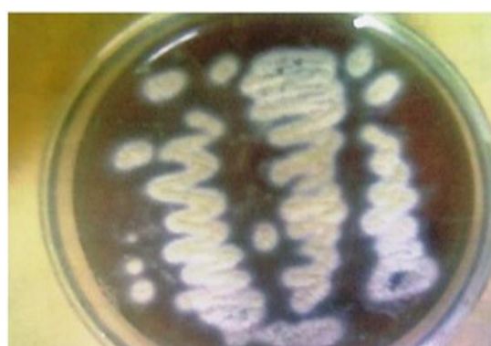
شکل ۲. رشد کلنی های آسپرژیلوس در محیط مجدد