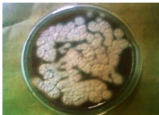
شکل ۱. رشد کلنی های آسپرژیلوس در محیط رزبنگال