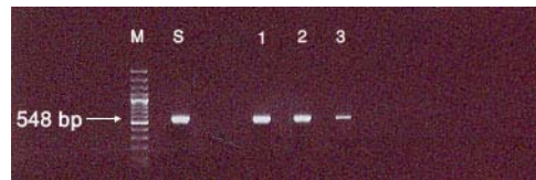
شکل ۱: در تمامی جدایه های انسانی و سویه های استاندارد پس از تکثیر ژن oxyR یک باند واجد ۵۴۸ جفت باز مشاهده شد. M : مارکر 100- S : محصول تکثیر شبه ژن oxyR در یکی از سویه های استاندارد